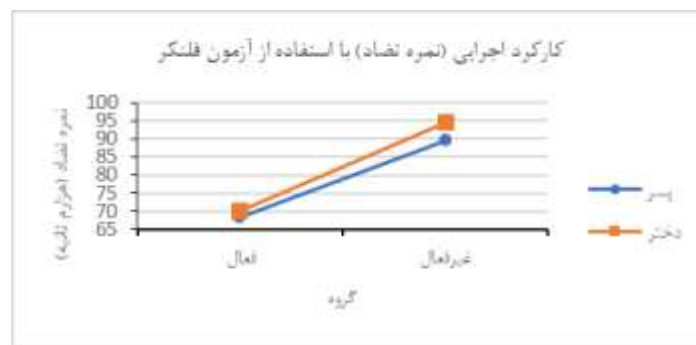
شکل ۱: تفاوت بین گروه‌های فعال و غیرفعال در کارکرد اجرایی بازداری پاسخ (نمره تضاد)

جهت بررسی تفاوت دو گروه فعال و غیرفعال حرکتی در کارکردهای اجرایی بازداری پاسخ و انعطاف‌پذیری شناختی با استفاده از تحلیل واریانس دو عاملی (گروه با ۲ سطح فعال و غیرفعال؛ جنسیت با دو سطح دختران و پسران)، نتایج حاصل نشان دادند که مطابق جدول ۱ و شکل ۱ و شکل ۲، در هر دو کارکرد اجرایی بازداری پاسخ و انعطاف‌پذیری شناختی، اثر اصلی گروه معنادار بوده ( P < 0/05 )، ولی اثر اصلی جنسیت و اثر تعاملی جنسیت با گروه معنادار نبودند ( P > 0/05 ). با توجه به میانگین گروه فعال ( 69/2 \pm 23/62 ) و غیرفعال ( 92 \pm 37/52 ) برای بازداری پاسخ و گروه فعال ( 6/7 \pm 3/87 ) و غیرفعال ( 9.62 \pm 5.25 ) برای انعطاف‌پذیری شناختی، گروه فعال حرکتی عملکرد دارای میانگین کارکردهای اجرایی بالاتری بودند.